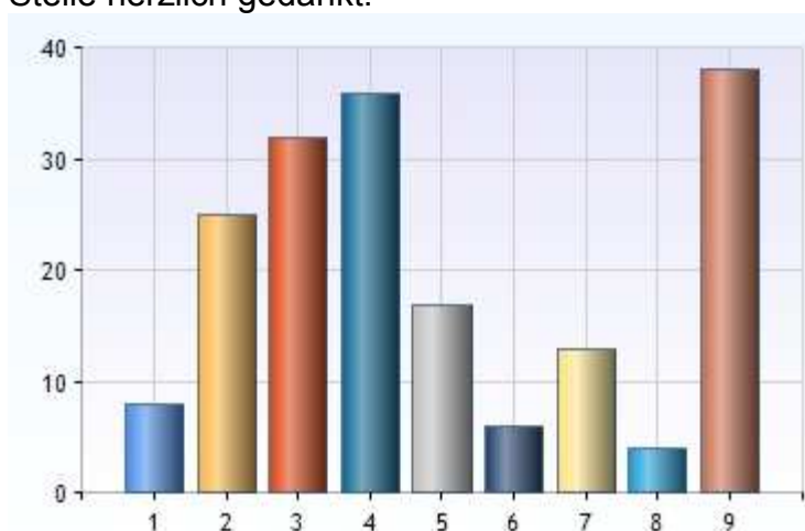
Abb. 2: Gründe für eine Nichtteilnahme am Lungentag